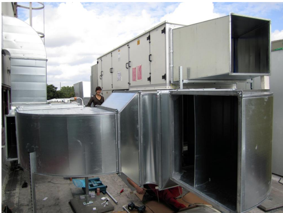
Neue Lüftungszentrale auf dem Dach.

erkennen. An den Schmalseiten der Schwimmhalle sind 24 neue so genannte Weitwurfdüsen montiert, die mit hohem Druck frische Luft in die Schwimmhalle pusten werden. Wichtiges Argument für die neue Lüftung: Sie spart Energie. Mit bis zu 20 Prozent weniger Verbrauch rechnen die Fachleute der BBB. Die neue Anlage hat drei Kernelemente: Zwei Lüftungszentralen im Keller und eine neue Station auf dem Dach.