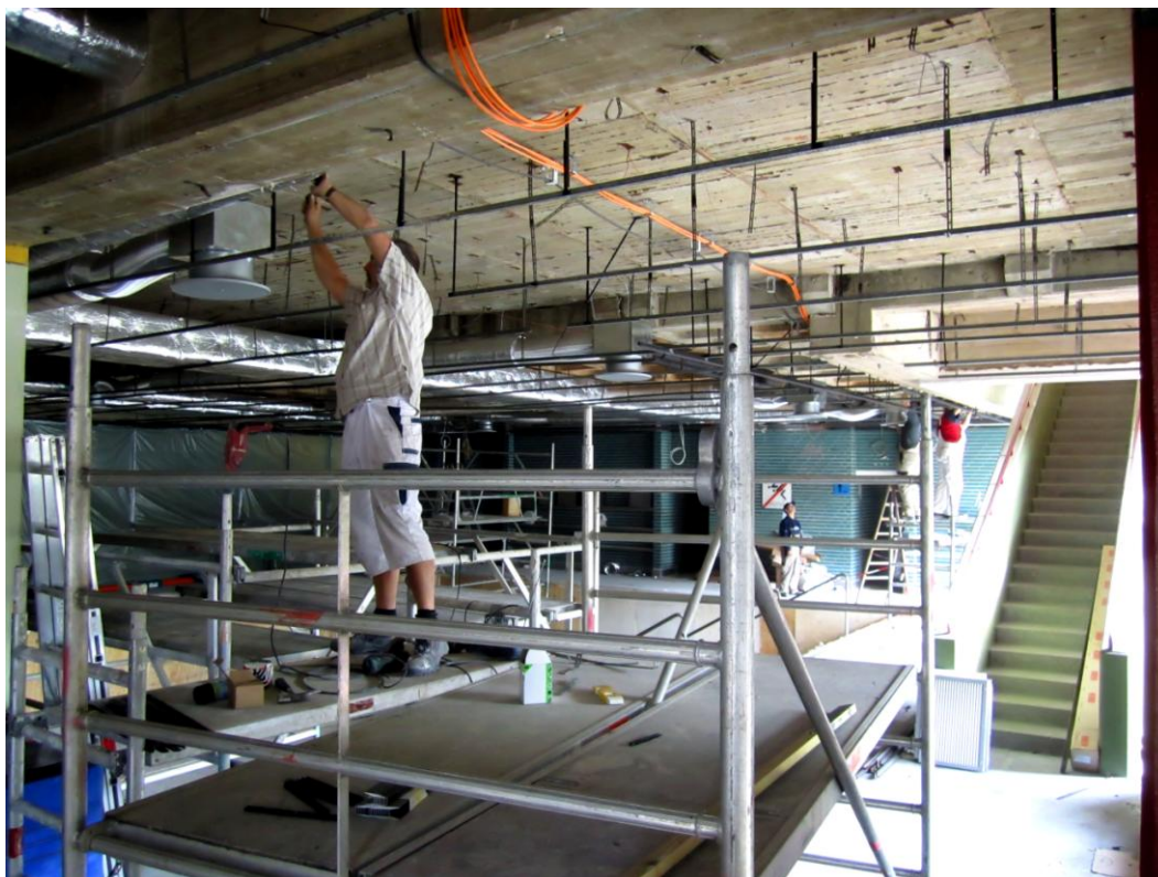
In der Lehrschwimmhalle wird die neue Abhangdecke montiert