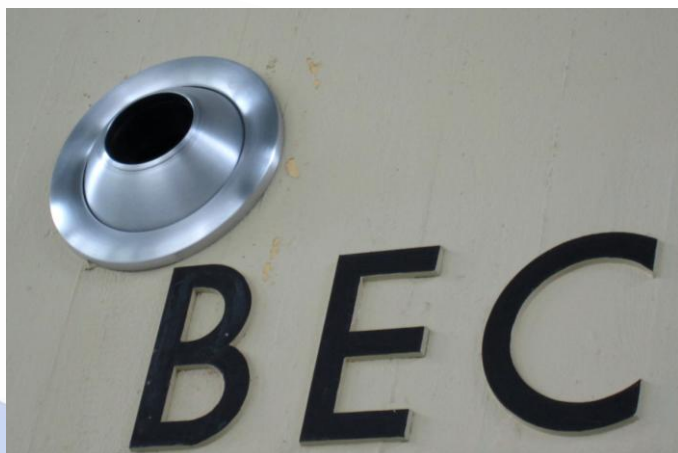
Die neuen silberfarbenen Luftdüsen in der Schwimmhalle.

Hinter den Kulissen blieb aber vieles nicht mehr, wie es war. Für rund 1,5 Millionen Euro ist die Halle, die auch den Bundesstützpunkt Wasserball beherbergt, nun mit einer neuen Lüftung ausgestattet. Rund 3500 Quadratmeter neue Lüftungskanäle sind installiert. Sie versorgen die Nutzerinnen und Nutzer ebenso mit frischer Luft von draußen wie die Gäste und Zuschauer der Wasserballer von Spandau 04. Man muss schon genau hinschauen, um die Veränderungen zu