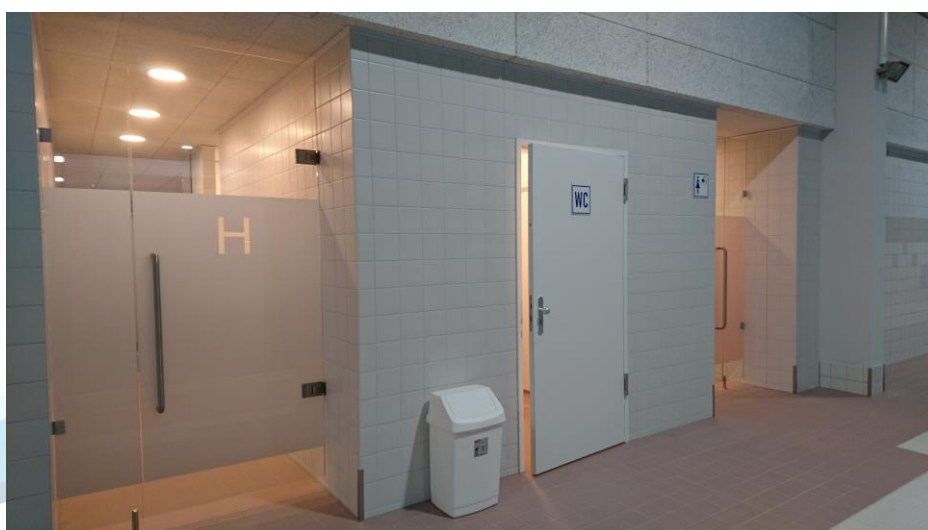
Türen zu den Duschen, immer geschlossen halten