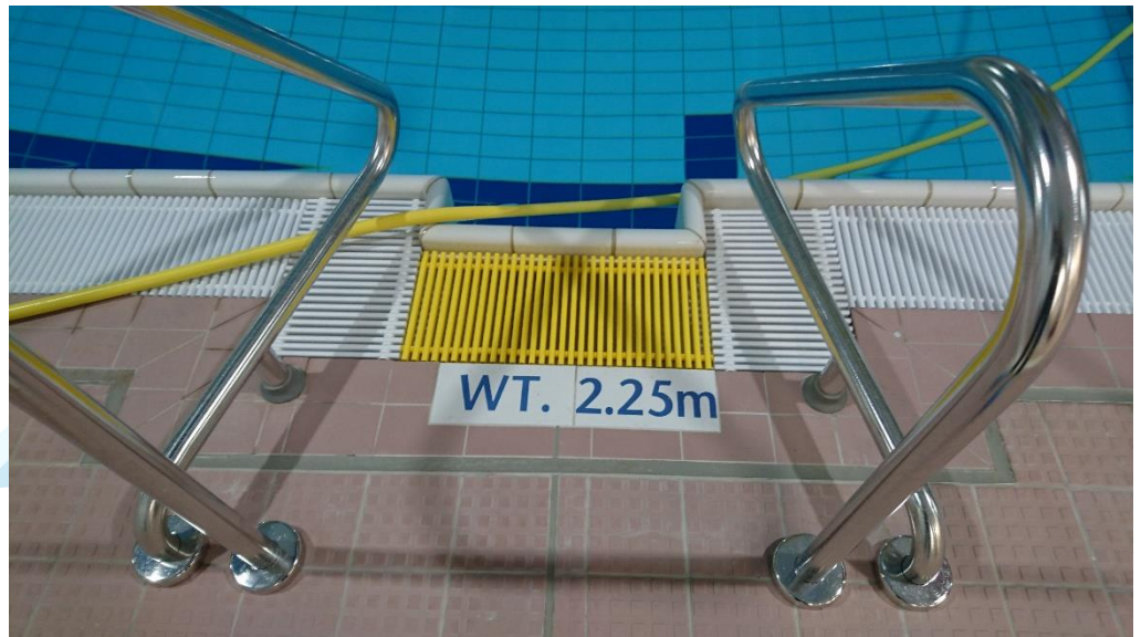
Wassertiefe im großen Becken