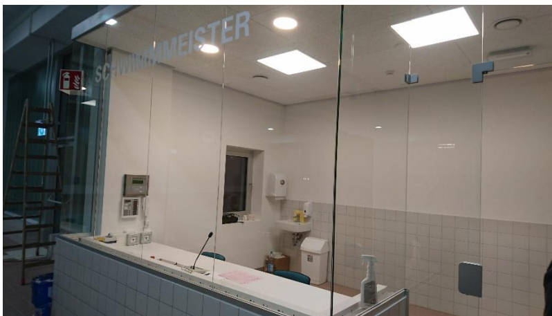
Neue Schwimmmeister- und Sani-Raum